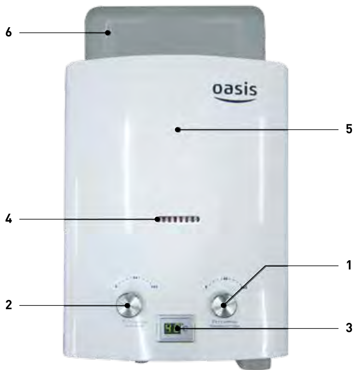
Рис. 1. Аппарат водонагревательный проточный газовый бытовой «OASIS» 1 - ручка водяного регулятора; 2 - ручка газового регулятора; 3 - цифровой индикатор температуры горячей воды; 4 - окно смотровое; 5 - облицовка; 6 - отражатель.

Составные части изделия, поясняющие принцип устройства аппарата и требующие технического обслуживания во время эксплуатации, показаны на Рис. 1.